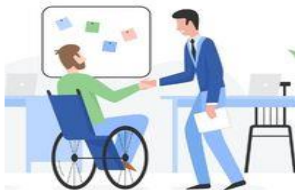
Трудоустройство людей с инвалидностью