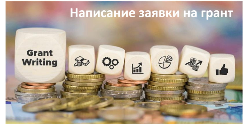
Написание заявки на грант