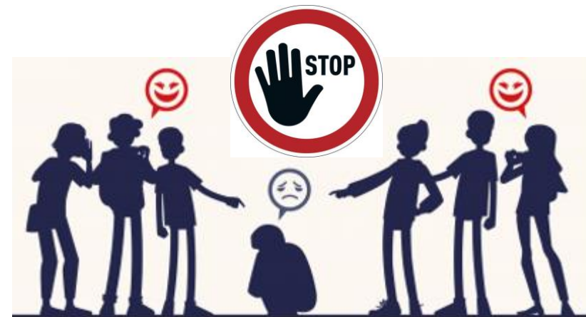
Профилактика травли в школе